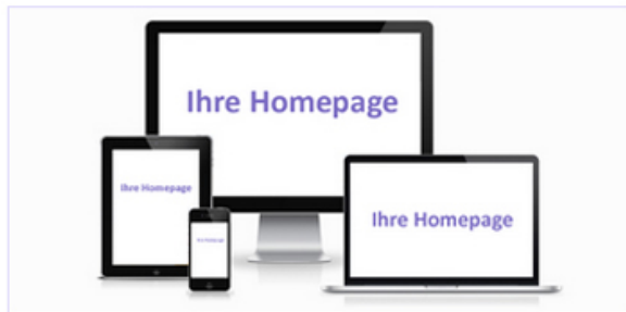
Hier könnte Ihr Web-Projekt stehen

In den Bereichen: Samariter Verein, Elektronik Engineering, Buchverlag, Webshop, Kosmetik, Security, Reinigung, Stressmanagement, Yogaschule, Yogalehrerausbildung