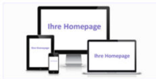
Hier könnte Ihr Web-Projekt stehen

In den Bereichen: Samariter Verein, Electronic Engineering, Buchverlag, Webshop, Kosmetik, Security, Reinigung, Stressmanagement, Yogaschule, Yogalehrerausbildung